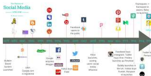
Gambar 1. Sejarah Perkembangan Media Sosial

Dalam era post-modern , muncul berbagai macam wadah untuk melakukan berbagai macam aktivitas, seperti pasar online ( online shop ) yang memungkinkan masyarakat untuk berbelanja secara daring, serta media sosial sebagai acuan utama dalam tulisan ini yang memberi akses kepada masyarakat untuk terhubung dengan satu sama lain. Eksistensi aplikasi seperti Facebook sejak tahun 2004, Youtube (2005), Twitter (2006), Instagram (2010) sebagai platform yang kerap digunakan, memberikan aliran baru terhadap proses pertukaran informasi.