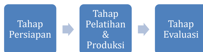
Gambar 1. Metode dan tahapan pengabdian kepada masyarakat

Secara garis besar metode pelaksanaan pengabdian di desa Banjarsari terbagi menjadi 3 tahapan yaitu, (1) Tahap Persiapan ; (2) Tahap Pelatihan & Produksi ; (3) Tahap Evaluasi.