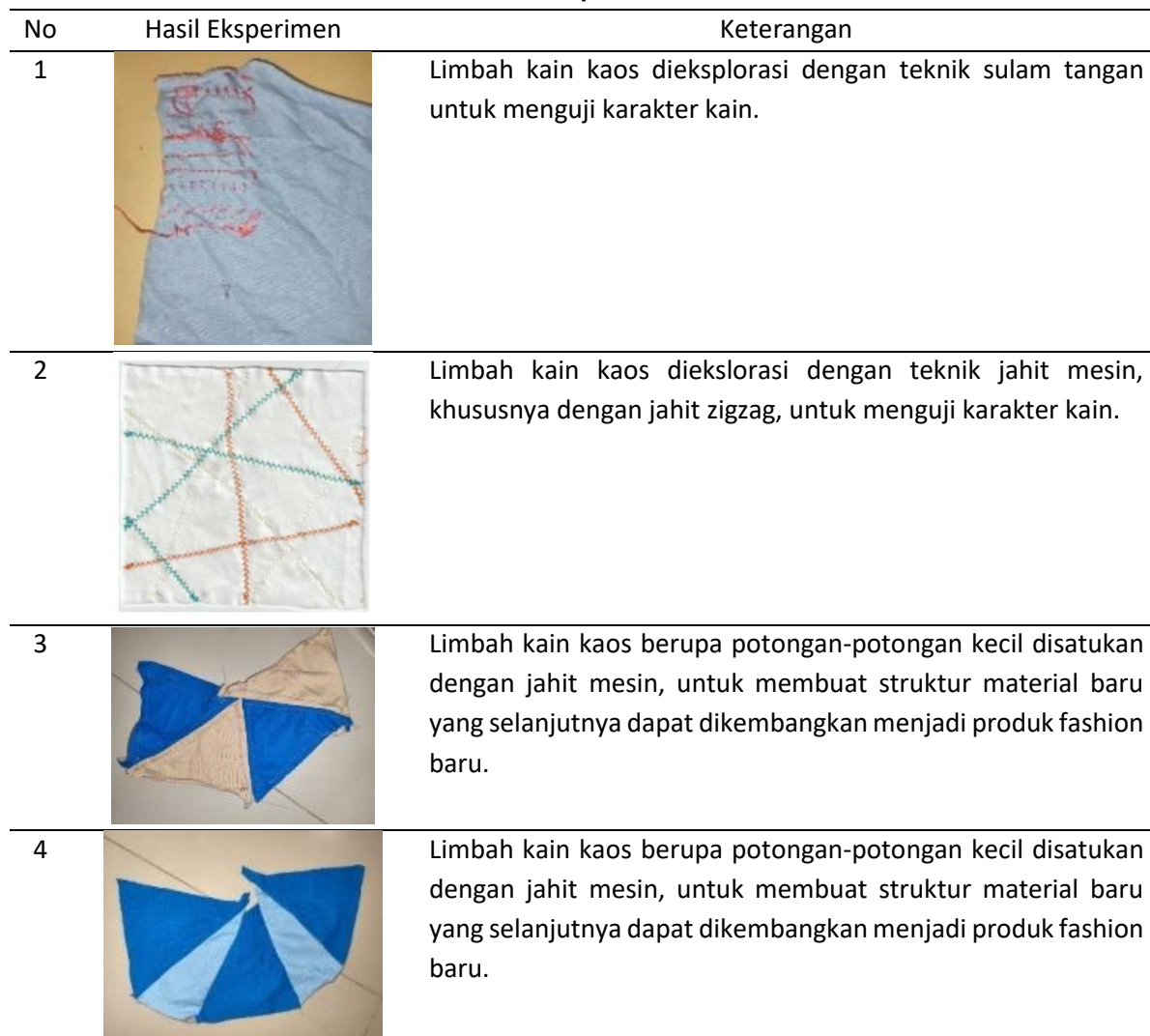
Tabel 2. Hasil eksperimen limbah kain kaos

Berdasarkan proses eksplorasi material limbah kain kaos yang telah dilakukan berikut adalah modul hasil eksperimen yang telah dihasilkan.