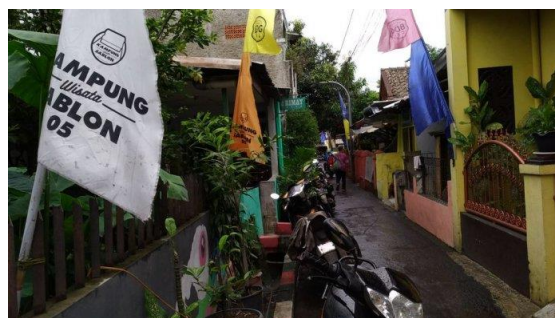
Gambar 2. Suasana Kampung Sabron di Gang Muararajeun

Berdasarkan observasi dan wawancara lebih lanjut yang dilakukan di tempat produksi kaos di Jalan Suci ini, banyak di antaranya yang menjadikan Jalan Suci sebagai tempat showroom -nya saja. Adapun tempat produksinya kebanyakan berada di daerah Muararajeun yang tidak jauh dari Jalan Suci, berjarak sekitar 1,5– 2 km.