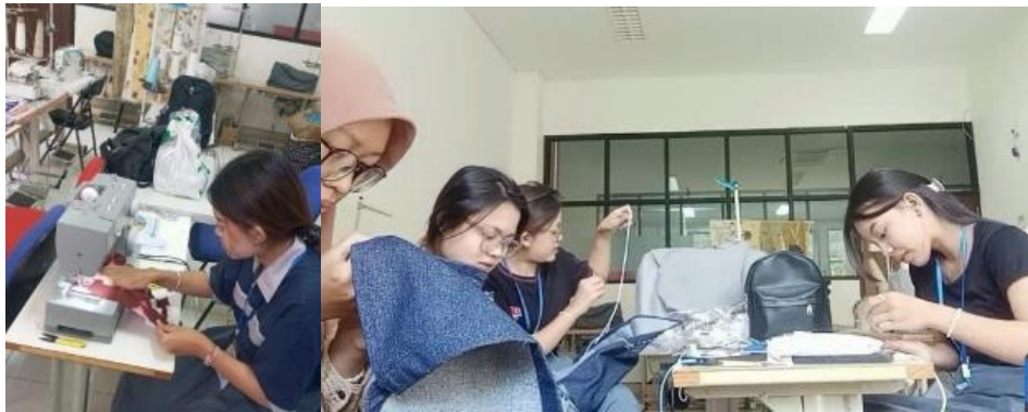
Gambar 6. Proses eksplorasi material limbah kain kaos

Berdasarkan proses eksplorasi material limbah kain kaos yang telah dilakukan berikut adalah modul hasil eksperimen yang telah dihasilkan.