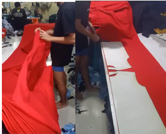
Gambar 4. Proses pola dan pemotongan kain kaos

Hal yang diamati selanjutnya yaitu proses produksi dari konfeksi kaos ini. Proses produksi diawali dengan membuat pola dan memotong kain. Dikarenakan jenis produk yang dihasilkan utamanya adalah kaos maka pola busana sebetulnya tidak rumit dan cenderung mudah karena pola kaos yang standar saja, tidak variatif. Hal yang membedakan biasanya hanya ukuran kaos yang akan diproduksi. Pola dan proses pemotongan pola pun dilakukan dengan cara reguler, maksudnya tidak dengan pertimbangan untuk lebih meminimalisir limbah atau Zero Waste Fashion Design sehingga limbah kaos yang dihasilkan di konfeksi kaos “DnR Production” dan juga konfeksi lainnya di Kawasan Kampung Sablon juga masih melimpah jumlahnya.