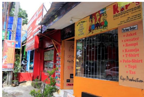
Gambar 1. Foto Konfeksi Kaos di Jalan Suci

Kota Bandung dikenal sebagai salah satu pusat industri fashion dan konfeksi di Indonesia. Perkembangan industri konfeksi di Bandung telah dimulai sejak tahun 1970-an dan semakin berkembang pesat pada dekade berikutnya seiring dengan meningkatnya permintaan pasar terhadap produk pakaian jadi. Hingga saat ini, berbagai sentra produksi konfeksi masih tersebar di beberapa wilayah di Bandung Raya, termasuk kawasan Jalan Surapati atau yang dikenal dengan sebutan Jalan Suci. Kawasan ini dikenal sebagai salah satu pusat perdagangan dan produksi kaos yang melayani permintaan dari berbagai daerah.