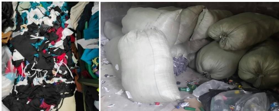
Gambar 5. Kain limbah sisa pemotongan pola yang dihasilkan

Produk yang dihasilkan pada konfeksi kaos ini biasanya berupa: kaos, polo shirt , sweater , baju olahraga dan jenis produk fashion lainnya yang terbuat dari kain kaos dan sejenisnya. Limbah kain yang dihasilkan biasanya berjenis: berbagai jenis kain kaos, katun combed , kain kaos PCV (campuran poliester), kain lacoste (kain untuk polo shirt) dan jenis kain kaos lainnya (Ariesta et al, 2021).