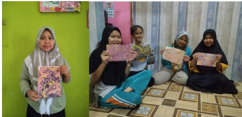
Gambar 8. Keterpakaian Produk Oleh Masyarakat Sasar