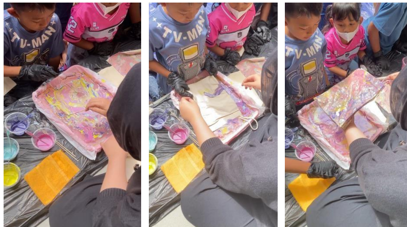
Gambar 6. Proses Pembuatan Merchandise Kreatif dengan Teknik Marbling

teknik marbling pada mini pouch yang akan dilakukan secara bergilir dapat dilakukan dengan lebih tertib. Dalam membuat motif menggunakan teknik marbling , anggota komunitas juga melatih kemampuan motorik halusnya dan mengenal kombinasi pencampuran warna. Mengingat harus saling bergantian dengan para anggota komunitas Rumah Pelangi Indonesia yang lainnya, diharapkan anggota komunitas dapat berlatih untuk tertib dan sabar menunggu giliran. Selanjutnya kegiatan workshop dilakukan secara bertahap, mulai dari pemaparan materi, menuangkan cat pada air, membuat motif dengan teknik marbling , mencelupkan mini pouch pada cat, dan pengeringan mini pouch . Workshop dilakukan selama tiga jam dan diselingi dengan games seputar tips and tricks teknik marbling .