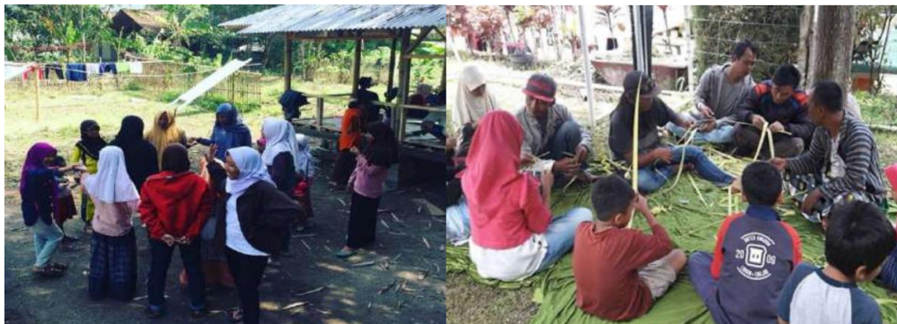
Gambar 4. Aktivitas Kegiatan Komunitas Rumah Pelangi

Setelah mengetahui fokus utama permasalahan, selanjutnya tim pengabdian masyarakat beserta mitra melakukan proses diskusi untuk menentukan batasan materi kegiatan, jadwal pelaksanaan kegiatan, bentuk kegiatan dan luaran dari kegiatan pengabdian masyarakat ini. Kegiatan workshop disepakati akan dilakukan di luar Rumah Pelangi Indonesia agar dapat membawa suasana pembelajaran yang baru bagi para anggota juga. Anggota Rumah Pelangi Indonesia yang akan mengikuti kegiatan ini berusia dari lima (5) hingga 10 tahun, yang berjumlah 55 anak.