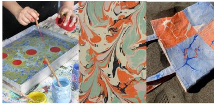
Gambar 1. Proses dan Hasil dengan Teknik Marbling