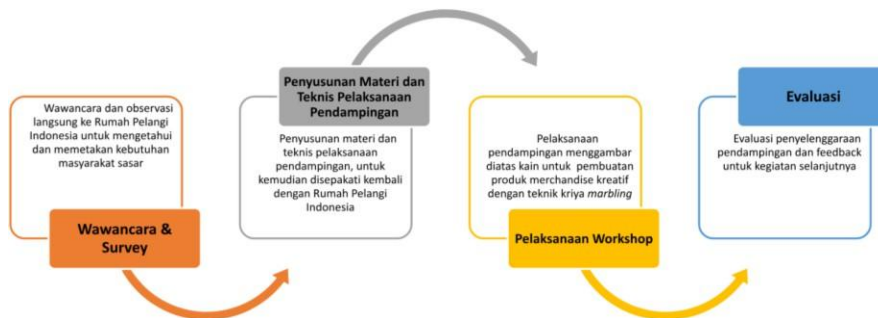
Gambar 2. Tahapan Pelaksanaan Kegiatan

Metode pelaksanaan dari kegiatan pengabdian kepada para anggota dan pengajar komunitas Rumah Pelangi Indonesia dilakukan secara bertahap dan disesuaikan dengan bidang pekerjaan dan target dari anggota tim, yang dideskripsikan pada gambar di bawah ini: