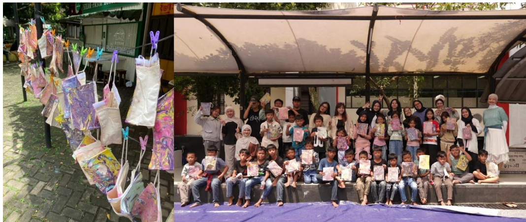
Gambar 7. Proses Pembuatan Merchandise Kreatif dengan Teknik Marbling