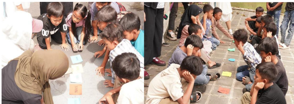
Gambar 5. Aktivitas Games Pengenalan Materi Workshop

Kegiatan dimulai sejak pukul 08.00 pagi, seluruh tim pengabdian masyarakat Telkom University dan seluruh anggota komunitas Rumah Pelangi Indonesia berkumpul di Selasar Kreatif. Kegiatan kemudian dimulai dengan berkeliling Telkom University sambil melakukan games . Games dilakukan sambil memaparkan materi mengenai teknik marbling dan penerapannya pada produk. Bagi para anggota komunitas Rumah Pelangi Indonesia yang menyimak dengan baik dan dapat menyelesaikan tantangan games , akan diberikan hadiah di akhir kegiatan. Diharapkan dengan melakukan games terlebih dahulu, para anggota komunitas Rumah Pelangi Indonesia dapat merasa lebih rileks dan fokus sebelum melakukan workshop pembuatan merchandise dan teknik marbling selanjutnya yang akan menghabiskan durasi waktu yang lebih lama.