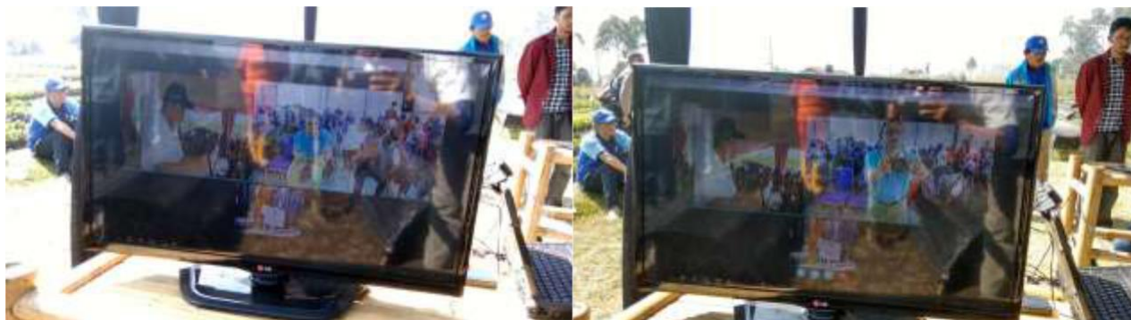
Gambar 3 Video Conference KKN Tematik Citarum Harum

Gladi Resik dilakukan untuk menguji kesiapan sistem pada H-1 peluncuran program (3 Mei 2018). Pelaksanaan gladi resik menguji parameter kuat sinyal seluler dan stabilitas saat digunakan untuk pelaksanaan video conference. Dari hasil pengujian didapatkan kesimpulan bahwa sinyal 3G/4G di lokasi perlu diperkuat dengan penguat sinyal seluler untuk mengatasi masalah stabilitas.