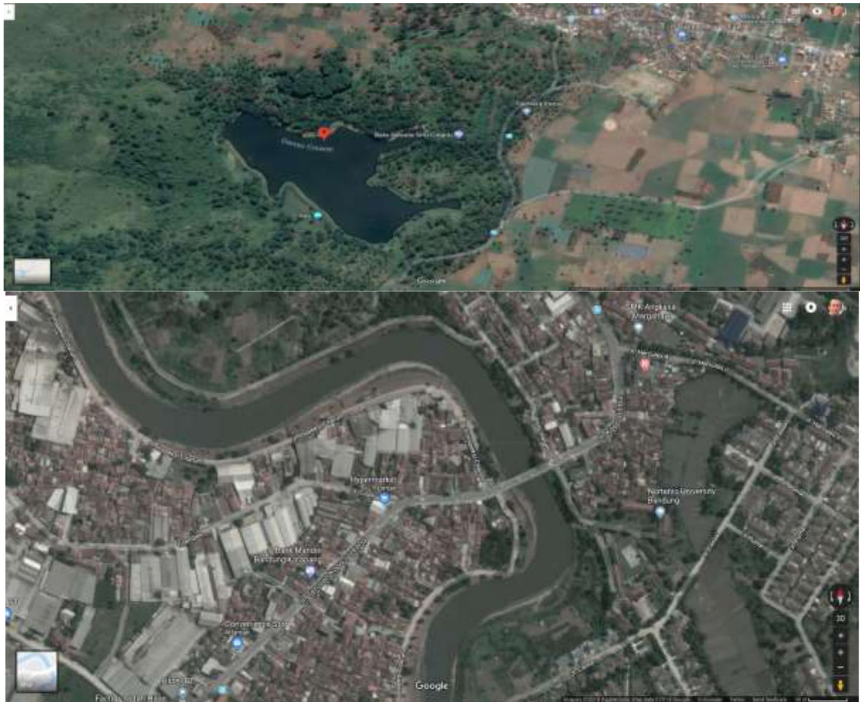
Gambar 1 Lokasi KKN tematik (atas) dan Lokasi Vicon tahap 2 (bawah)

Sistem video conference antara lokasi KKN Tematik Citarum Harum antar sector yang berbeda dapat dilihat pada topologi berikut;