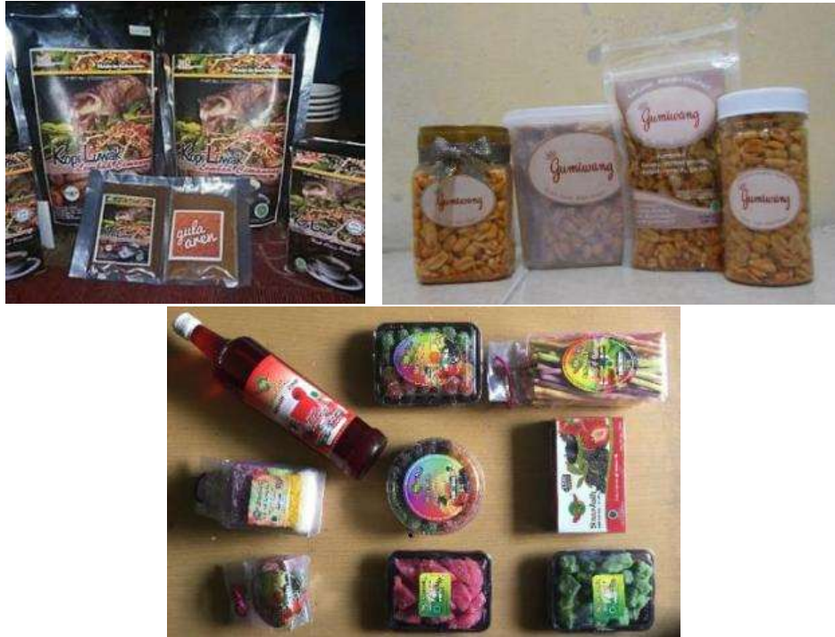
Gambar 1 Kemasan Produk UKM Kabupaten Bandung

Untuk itu, menarik bagi kami tim dosen Desain Komunikasi Visual Universitas Telkom mengangkat topik kemasan yang persuasif dalam program pengabdian masyarakat yang ditujukan bagi kelompok masyarakat yang kurang produktif.