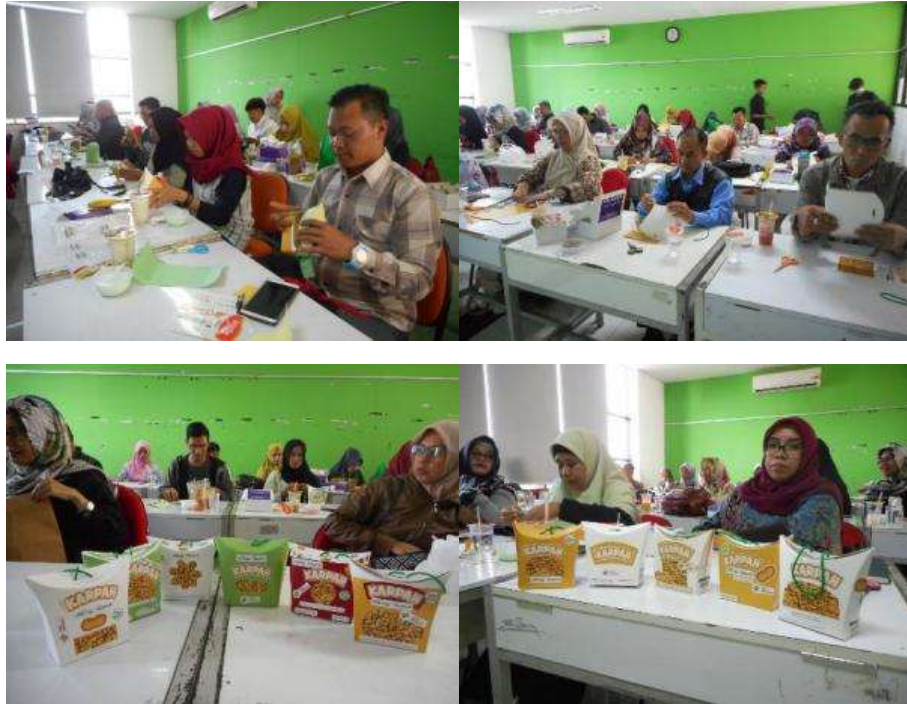
Gambar 4 (atas) Suasana ketika peserta berkreasi membuat kemasan karton dan Primary Display Panel; (bawah) beberapa hasil kreasi terbaik dari peserta pelatihan

Program Pengabdian kepada Masyarakat ini memiliki luaran berupa pelatihan. Jika dilihat kesesuaian dengan kondisi masyarakat dalam hal ini pelaku UKM dan Koperasi Kabupaten Bandung, maka program ini memiliki keunggulan di mana peserta tidak hanya mendapat materi berupa teori saja, namun juga praktek langsung.