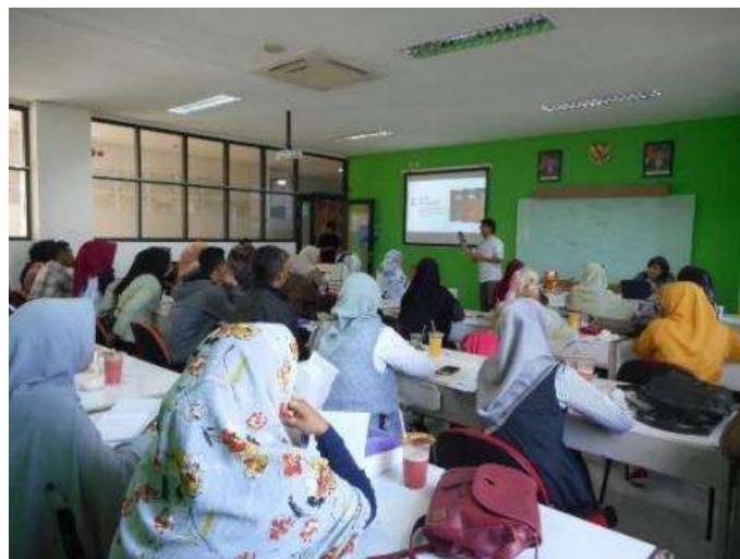
Gambar 3 Suasana ketika pemaparan materi

Pertama-tama, peserta diberikan pengetahuan dasar mengenai definisi dan fungsi kemasan. Pengemasan mempunyai dua fungsi, pertama fungsi protektif yakni melindungi produk dari perbedaan iklim, prasarana transportasi, dan saluran distribusi; kedua fungsi promosi yang menyangkut promosi perusahaan, dengan mempertimbangkan preferensi konsumen pada aspek warna, ukuran, dan penampilan [4]. Kemudian, materi dilanjutkan dengan pemaparan mengenai tujuan pengemasan serta bahan-bahan yang sering dipakai sebagai bahan dasar kemasan.