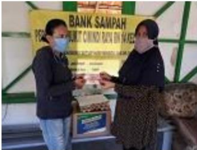
Gambar 3. Warga RW 14 Menerima Bantuan Gubernur Jabar