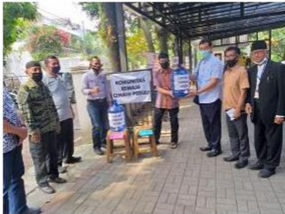
Gambar 2. Penerimaan Bantuan Kepada RW Paskal di Kelurahan