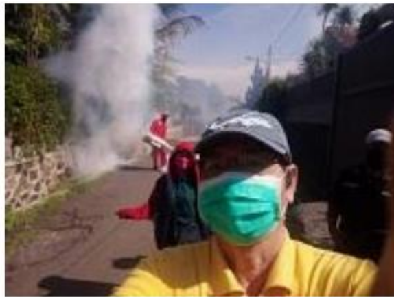
Gambar 4. Penyemprotan di RW 14