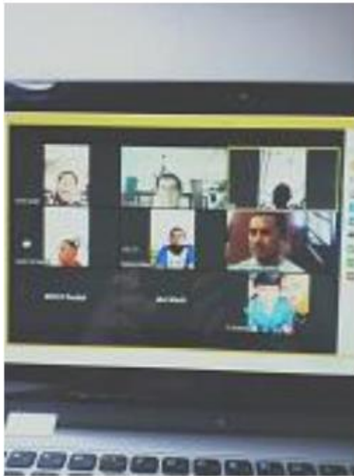
Gambar 1. Rapat Forum Ketua RW Paskal dengan Lurah