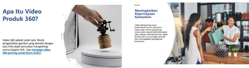
Gambar 4. Video tutorial PowerPoint , Pembuka (a) dan Materi (b)