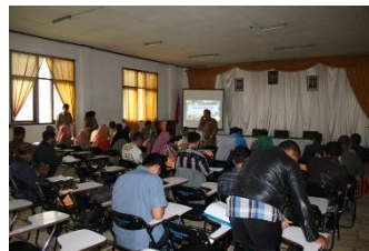
Gambar 1. Lokasi tempat Abdimas (a) dan Aktifitas mitra (b)