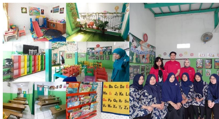
Gambar 1. Kondisi tempat mitra (a) dan tim dosen tel-u, guru dan staff AN-Nur (b)

Yayasan AN-NUR memiliki Fasilitas antara lain tersedianya APE (Alat Permainan Edukatif) dalam yang meliputi puzzle, alat susun, balok kayu dan buku penunjang ide kreatif anak dalam menyerap pembelajaran, serta Yayasan AN-NUR memiliki APE luar seperti perosotan, angkat ungkit dan ayunan yang tersedia terbuka sebagai fasilitas wajib bagi Pendidikan anak usia dini, Yayasan AN-NUR memiliki anak didik sebanyak 100 siswa untuk PAUD, 20 untuk Play Group, 40 untuk TAAM, 60 untuk Art Therapy dan 60 untuk Lansia yang mengikuti Tazqirah setiap seminggu sekali yang di adakan setiap malam jumat setiap minggu nya. Dan Yayasan AN-NUR pula menjadi sarapa Pendidikan anak usia dini peringkat 1 di kecamatan Andir kota Bandung.