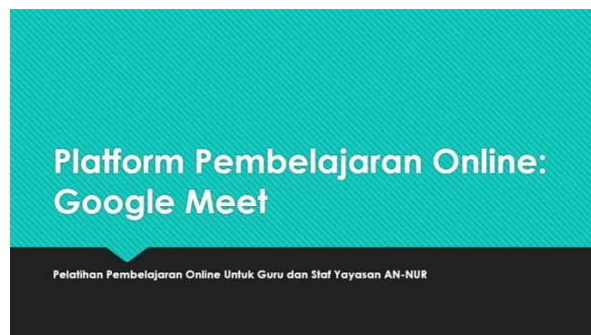
Gambar 3. Materi Pelatihan

Setelah proses administrasi selesai, kemudian dilakukan penyusunan materi. Materi pelatihan berfokus pada wawasan terkait pembuatan googlemeet untuk media pembelajaran pertemuan tatap muka bagi anak-anak usia dini menggunakan laptop dan smartphone, teknis dan cara pembuatan googlemeet dalam rangka menunjang kegiatan pembelajaran bagi anak usia dini di Yayasan AN-Nur. Praktik langsung akan dilakukan secara tatap muka di lokasi Abdimas berlangsung. Selain itu materi tersebut juga dikemas dalam bentuk PPT, dengan harapan dapat dipelajari secara mandiri dan berkala. Kegiatan pelatihan ini memiliki potensi untuk dilanjutkan setiap tahunnya dengan pemberian materi yang berbeda, namun masih berkaitan dengan bidang Pendidikan di industry Kreatif. Beberapa poin materi yang disampaikan pada pelatihan ini yaitu :