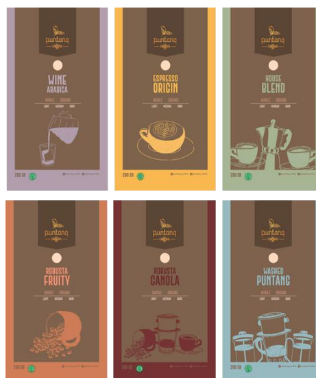
Gambar 5. Ilustrasi pada Kemasan Depan

Adapun warna coklat dipakai sebagai warna dominan produk. Warna coklat dipilih untuk menginformasikan isi kemasan. Warna coklat identik dengan kopi. Adapun kombinasi warna digunakan untuk membedakan varian produk. Tampilan kemasan depan dan belakang menggunakan kombinasi warna yang berbeda-beda sehingga varian produk dapat dibedakan satu sama lainnya. Gambar 5 menampilkan berbagai varian produk yang dibedakan melalui ragam ilustrasi dan kombinasi warna.