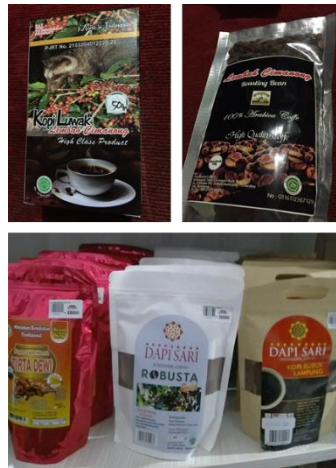
Gambar 1. Desain Grafis Kemasan Kopi produk UKM Kabupaten Bandung

mendapatkan desain kemasan yang dikerjakan oleh percetakan atau produsen kemasan [10].