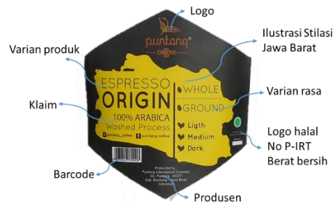
Gambar 4. Label Kemasan

Untuk label kemasan, digunakan stiker yang ditempel pada tampak depan kemasan saja, sedangkan bagian belakang kemasan dibiarkan polos. Label kemasan ditunjukkan pada Gambar 4. Secara umum, informasi yang terdapat pada label kemasan sudah memenuhi kaidah yang ditetapkan Badan Pengawas Obat-obatan dan Makanan Republik Indonesia (B-POM RI) [11]. Informasi tersebut di antaranya pencantuman logo, varian produk, produsen, logo halal, nomor P-IRT, dan berat bersih yang merupakan informasi wajib. Adapun klaim tidak wajib dicantumkan, dan apabila dicantumkan harus memenuhi kaidah yang ditetapkan B-POM RI tersebut. Adapun varian rasa dicantumkan semua, dan nantinya produsen memberi tanda pada varian yang dimaksud menggunakan spidol. Hal ini dimaksudkan untuk meminimalkan ongkos produksi, sehingga produsen tidak perlu mencetak berbagai label dengan varian rasa dan varian produk yang berbeda-beda. Hal ini sering pula dijumpai pada kemasan produk UKM.