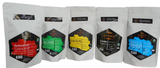
Gambar 3. Tampilan Kemasan Awal Beberapa Varian Produk

Kegiatan utama dalam Pengabdian kepada Masyarakat ini bertujuan untuk merancang kemasan kopi yang beragam disesuaikan dengan varian yang berbeda-beda. Dari survey lapangan, dokumentasi, dan wawancara ditemukan bahwa logo Puntang Coffee telah terdaftar. Meskipun demikian, branding yang dibangun dirasakan belum sempurna. Hal ini disebabkan desain kemasan yang dimiliki belum menampilkan karakter masing-masing varian produknya yang mana memiliki beragam olahan kopi.