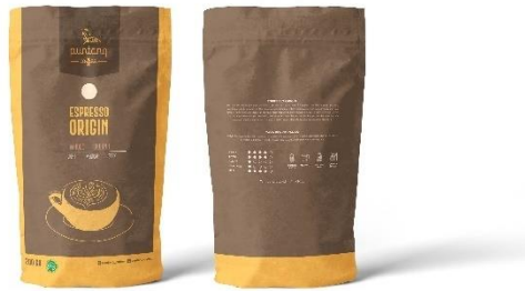
Gambar 6. Tampilan Kemasan Depan dan Belakang

Tahap selanjutnya adalah membuat final artwork , diakhiri dengan membuat mock-up kemasan. Final artwork sebagaimana ditampilkan pada Gambar 6 berupa desain kemasan standing pouch dengan grafis kemasan yang dicetak langsung pada kemasan (bukan berupa tempelan stiker). Desain grafis kemasan terdapat pada kedua sisi (depan dan belakang) untuk memaksimalkan informasi produk yang ingin disampaikan, namun tetap memperhatikan kaidah/ prinsip desain dalam menata layout panel kemasan. Adapun prinsip desain yang dimaksud di antaranya penekanan, hirarki dan dominan [16]. Prinsip penekanan didapat melalui ilustrasi line-art . Prinsip hirarki terlihat dengan penggunaan ukuran gambar atau tulisan yang mana semakin besar gambar atau tulisan tersebut menunjukkan semakin pentingnya informasi yang ingin disampaikan. Prinsip dominan ditampilkan melalui gambar yang besar dan juga warna yang mendominasi.