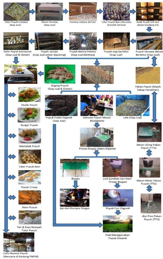
Gambar 2. Hasil Pengabdian Masyarakat Peternakan Puyuh Terintegrasi

Prestasi kegiatan peningkatan akselerasi dan efektifitas program pembangunan dapat dilihat dari bukti lapangan dimana semakin baiknya kualitas kehidupan masyarakat dan semakin meningkatnya partisipasi dan keberdayaan masyarakat dalam pembangunan. Kerjasama yang terintegrasi diantara Perguruan Tinggi, Pemerintah Daerah dan Masyarakat memberi dampak pada peningkatan kesejahteraan masyarakat.