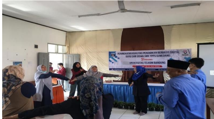
Gambar 3: Kegiatan Pembekalan Peningkatan Kualitas Pendidikan Berbasis Digital Bagi Guru SMK YPPs

Berikut adalah susana kelas pada saat pemberian materi, praktik dan icebreaking serta pemberian hadiah berupa buku kepada para guru yang terlihat pada gambar dibawah ini: