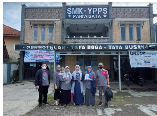
Gambar 2: Pemberian apresiasi dalam bentuk buku dosen FEB dan FKB

Evaluasi dilakukan dengan menggunakan kahoots.com yaitu melalui pertanyaan-pertanyaan konten digital dengan pemberian gimmick pada guru-guru yang berhasil berada pada peringkat teratas.