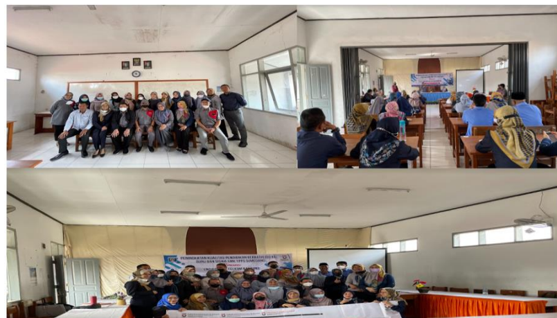
Gambar 4 : Foto Bersama Awal dan Setelah Kegiatan Pembekalan Materi SMK YPPs Sumedang