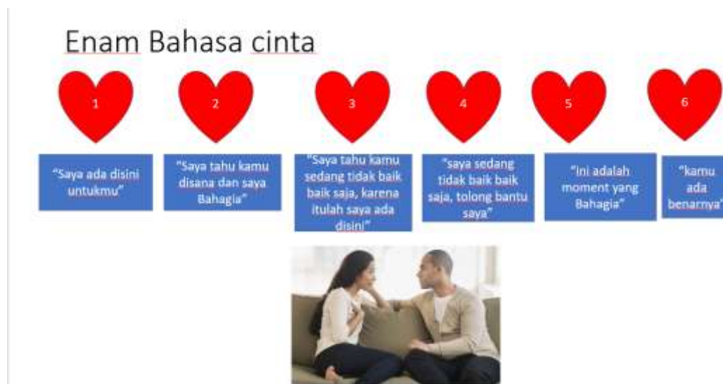
Gambar 3: Bahasa cinta

Mereka juga harus berusaha keluar dari hubungan toxic jika tidak ada perbaikan yang berarti. Mencintai pasangan bukan berarti tidak dapat melihat keburukan pasangan. Melepaskan diri dari hubungan yang tidak sehat harus dilakukan sebelum mengarah pada hubungan yang lebih membahayakan kesehatan mental. Umumnya pasangan yang terlibat hubungan toxic butuh waktu beberapa tahun melepaskan diri dari hubungan Toxic. Cepat atau lambatnya terbebas dari hubungan Toxic umumnya karena beberapa kondisi diantaranya situasi dan tidak ada social support.