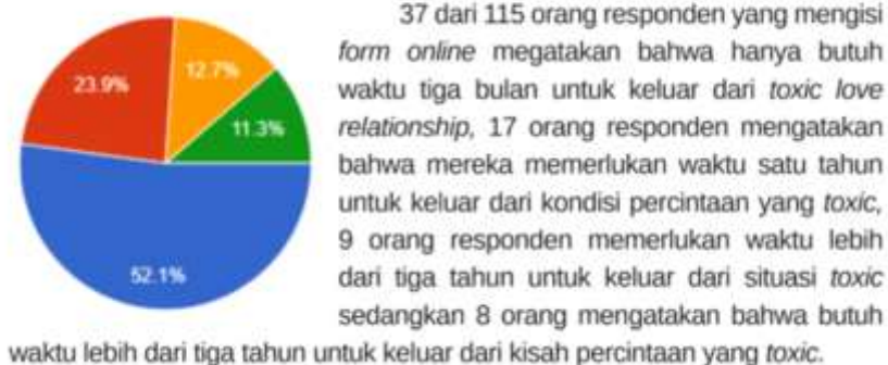
Gambar 1: Hasil Survey Toxic Relationship