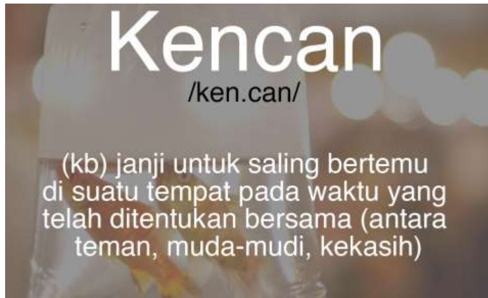
Gambar 2: Kencan

Setelah dilakukan pemahaman terkait kencan dan segala sesuatu terkait hubungan sehat, maka peserta diberikan pemahaman untuk dapat melakukan revisi komunikasi, jika memiliki hubungan yang bermasalah. Revisi komunikasi yang dilakukan oleh peserta dengan menggunakan pendekatan psikologi positif dimulai dengan melakukan komunikasi interpersonal yang sehat. Umumnya hubungan toxic yang terjadi karena kualitas hubungan yang menurun, karena itulah perbaikan dimulai dengan menggunakan empati, saling memahami perasaan satu sama lain, menggunakan Bahasa cinta masing-masing pasangan. Bahasa Cinta dilakukan dengan saling memahami kedudukan masing-masing dan memberikan dukungan baik moral maupun fisik (Achmanto, 2005)