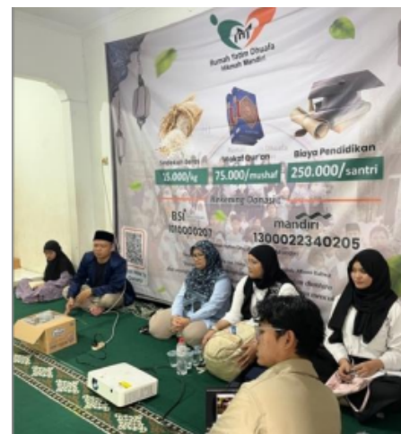
Gambar 6. Dokumentasi Kegiatan Demo Aplikasi

Pada tahap evaluasi pengguna sistem, tim melakukan kunjungan ke rumah yatim pada tanggal 12 November 2025 untuk melakukan demo antarmuka website dengan pengurus rumah yatim untuk mendapatkan umpan balik dari pengurus rumah yatim. Dokumentasi kegiatan demo aplikasi dapat dilihat pada Gambar 6.