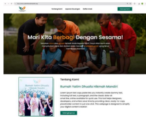
Gambar 2. Profil Rumah Yatim

Fitur ini menampilkan informasi umum rumah yatim, termasuk visi, misi, dan legalitas lembaga rumah yatim. Fitur ini dapat meningkatkan kejelasan identitas rumah yatim bagi masyarakat luas. Tampilan halaman profil rumah yatim dapat dilihat pada Gambar 2.