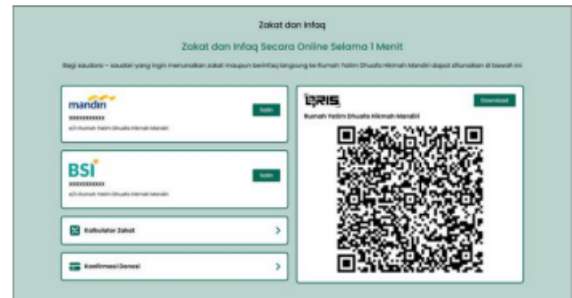
Gambar 3. Fitur Donasi Zakat dan Infaq

Fitur donasi zakat dan infaq menyediakan informasi mengenai jenis donasi, nomor rekening, dan formulir konfirmasi donasi yang terintegrasi dengan kalkulator zakat. Keberadaan fitur ini menjawab kendala sebelumnya, di mana calon donatur harus menghubungi pengurus secara langsung melalui aplikasi pesan instan untuk memperoleh informasi cara menyalurkan donasi. Dengan adanya halaman donasi yang terstruktur, proses akses informasi menjadi lebih cepat dan transparan, sehingga diharapkan dapat meningkatkan kepercayaan donatur terhadap pengelolaan dana oleh Rumah Yatim Dhuafa Hikmah Mandiri. Tampilan halaman fitur donasi zakat dan infaq dapat dilihat pada Gambar 3.