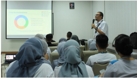
Gambar 2. Penyusunan Manual SJPH

Tahap berikutnya yang dilakukan setelah pelatihan adalah penyusunan manual sistem jaminan produk halal (SJPH) beserta lampirannya. Kegiatan ini tertunda dari jadwal yang telah ditetapkan sebelumnya karena pelaku usaha sedang dalam tahap akhir renovasi bangunan usaha. Kegiatan penyusunan manual SJPH dilakukan bersama antara tim pendamping dengan pelaku usaha. Foto kegiatan dapat dilihat di gambar 2.