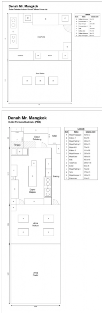
Gambar 6. Layout Outlet Area Kerja Mr. Mangkok

Selanjutnya, dilakukan pemetaan fasilitas melalui penyusunan denah dan layout untuk mendukung identifikasi area kerja, penataan alur aktivitas, serta pemetaan titik kritis halal pada dua lokasi layanan Mr. Mangkok, yaitu Outlet Permata Buahbatu (PBB) dan Outlet Fakultas Industri Kreatif Telkom University . Denah disusun berdasarkan observasi fasilitas dan alur kerja di masing-masing outlet , kemudian digunakan sebagai dasar penetapan area produksi dan area penunjang agar pengendalian kebersihan serta pemisahan area dapat diterapkan lebih konsisten. Contoh representatif denah outlet yang digunakan sebagai bagian dari dokumen SJPH ditampilkan pada Gambar 6.