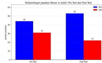
Gambar 7. Hasil Pre Test dan Post Test

hasil pre-test dan post-test ditampilkan pada Gambar 7, yang memperlihatkan bahwa total jawaban benar meningkat dari 44 menjadi 53, sedangkan jawaban salah menurun dari 31 menjadi 22, dengan total respons tetap 75 pada masing-masing tahap. Proporsi jawaban benar naik dari 58,7% menjadi 70,7%, yang mengindikasikan bahwa pelatihan onsite dan pendampingan SJPH efektif meningkatkan pemahaman peserta serta mengurangi miskonsepsi. Peningkatan ini menjadi modal awal bagi mitra untuk menjalankan prosedur SJPH secara lebih konsisten, khususnya pada aspek kontrol bahan dan pemenuhan bukti dokumenter.