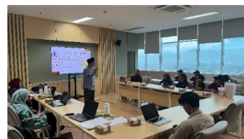
Gambar 4. Pendampingan dan Pelatihan Mitra

Pada fase peningkatan kapasitas, dilakukan pelatihan internal secara luring dengan materi konsep halal–haram, najis, pengantar sertifikasi halal, dan penerapan SJPH. Efektivitas pelatihan dievaluasi menggunakan instrumen pre-test dan post-test untuk menangkap perubahan peserta setelah intervensi. Hasil pre-test direkap sebagai data kuantitatif evaluasi pembelajaran.