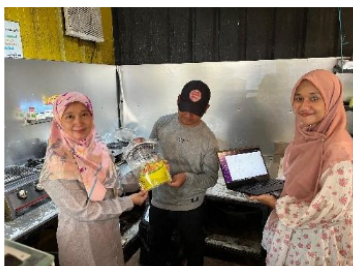
Gambar 5. Audit Mitra oleh Tim

Pada fase pendampingan, data dikumpulkan melalui telaah dokumen dan checklist kelengkapan dokumen SJPH, serta verifikasi lapangan atas praktik kontrol bahan dan pemisahan/pengendalian area kerja. Pendampingan menitikberatkan pada penyusunan dan perapihan artefak SJPH beserta lampiran bukti, termasuk penguatan administrasi pengendalian bahan misalnya konsistensi pencatatan pembelian dan pemeriksaan kesesuaian bahan mengacu pada Daftar Bahan Halal. Selain itu, dilakukan koordinasi internal tim dan mitra untuk memastikan kesiapan menghadapi proses pemeriksaan atau asesmen (audit kesiapan) sesuai kebutuhan kegiatan.