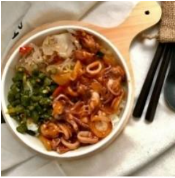
Gambar 1. Produk Mr. Mangkok Ricebowl