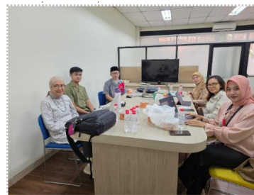
Gambar 3. DKegiatan FDG bersama Mitra

Subjek kegiatan adalah personel internal mitra pemilik dan staf operasional yang terlibat langsung dalam aktivitas produksi, penyajian dan administrasi bahan. Kegiatan dilaksanakan pada lokasi operasional mitra di Bandung, yaitu Outlet Permata Buah Batu dan Outlet Fakultas Industri Kreatif Telkom University , untuk memastikan observasi fasilitas, alur kerja, serta bukti-bukti kontrol internal dapat diverifikasi secara kontekstual. Pengumpulan data menggunakan instrumen kualitatif dan kuantitatif yang disesuaikan dengan tujuan kegiatan. Pada fase diagnosis awal, digunakan lembar observasi (kondisi fasilitas, alur proses, potensi titik kritis halal), panduan wawancara, dan FGD untuk mengidentifikasi gap kesiapan SJPH serta menentukan prioritas pendampingan. Bukti kegiatan pada fase ini didokumentasikan melalui notulen, daftar hadir, dan dokumentasi foto.