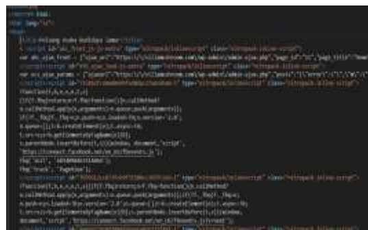
Gambar 3.1. Source code tanpa SEO

Pendampingan Pengoptimalan SEO dengan metode on-page . Metode ini mengarah pada faktor-faktor yang ada di dalam konten. Secara sederhana, on-page SEO dapat diartikan sebagai langkah optimasi meningkatkan kualitas konten agar mudah dibaca dan dipahami pembaca website. Berikut perbandingan source code sebelum menggunakan on-page SEO dan setelah setelah menggunakan on-page SEO pada situs resminya : https://villamushroom.com/