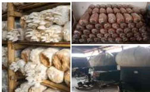
Gambar 1.2. Budidaya Jamur Tiram Putih