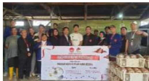
Gambar 1.1. Kegiatan Pengabdian Kepada Masyarakat di Villa Mushroom Agrifarm

Pelatihan ini akan memberikan manfaat yang sangat besar dalam penyebaran informasi pemasaran yang efektif untuk meningkatkan traffic website Villa Mushroom Agrifarm dan bisnis jamur tiram putih semakin dikenal. Waktu pelaksanaannya dimulai bulan September Tahun 2023 hingga sekarang. Penerima manfaatnya adalah Villa Mushroom Agrifarm sebagai pembudidaya jamur tiram putih, masyarakat luas dan Perguruan Tinggi.