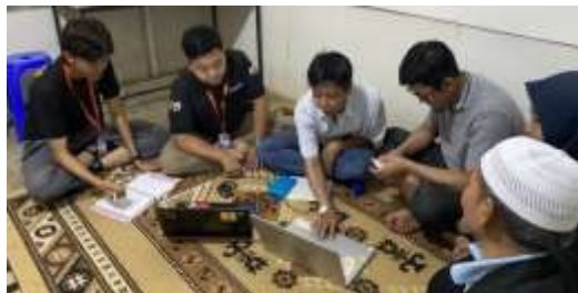
Gambar 3.4. Pelatihan pemberian komentar positif

Dari gambar di atas terlihat bahwa saat ini respon komentar positif ada pada posisi bintang 5, hal ini karena yang memberikan respon masih diputaran rekan-rekan pembudidaya jamur tiram putih, hal ini harus dipertahankan dengan menjaga kualitas pelayanan dari Villa Mushroom Agrifarm ini agar jika nanti user yang benar-benar memberikan komentar dapat memberikan komentar yang positif juga.