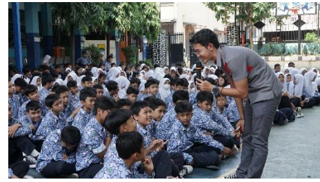
Gambar 2. Diskusi tentang Literasi Lingkungan

Pelatihan ini diikuti 243 siswa-siswi dari SMP Negeri 6 Bandung kelas IIX. Pelatihan dibuka dengan pengenalan dan materi pertama selama satu jam seperti pada Gambar 1.