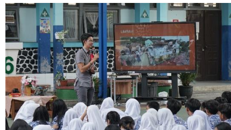
Gambar 3. Praktik Menjaga Lingkungan

Setelah pemaparan materi selesai, sesi selanjutnya adalah diskusi dan tanya jawab yang diikuti sesi praktik menjaga lingkungan seperti pemilahan sampah, daur ulang, dan menerapkan gaya hidup rendah karbon seperti bersepeda. Sesi ini terlihat pada Gambar 2. Sesi praktik menjaga lingkungan ini menitikberatkan untuk menumbuhkan kesadaran lingkungan melalui literasi lingkungan. Setelah sesi ini selesai, pelatihan ditutup dengan evaluasi diri dan pengisian umpan balik.