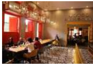
Gambar 6: Pengunjung Area Kursi Cafe

Menurut pengamatan yang dilakukan sejak pukul 15.00 hingga 22.00 WIB, jenis fasilitas duduk ini di dominasi oleh kalangan dewasa yang sedang membicarakan tentang pekerjaan. Area fasilitas duduk kursi cafe memiliki suasana yang lebih serius dibandingkan area tempat duduk lainnya, sehingga lebih cocok digunakan untuk meeting dan diskusi pekerjaan. Untuk kalangan remaja sendiri, ada beberapa pengunjung remaja yang duduk di area tempat duduk tersebut dan merekapun juga membuka laptop dan bukunya untuk belajar dan mengerjakan tugas. Tetapi, berbeda dengan pengunjung dewasa yang hanya bertujuan untuk meeting lalu pulang, pengunjung kalangan remaja akan menunggu sampai area kursi lain yang lebih nyaman kosong dan berpindah tempat atau dapat disimpulkan bahwa jenis fasilitas duduk kursi cafe juga digunakan sebagai tempat bersinggah sebentar oleh para remaja.