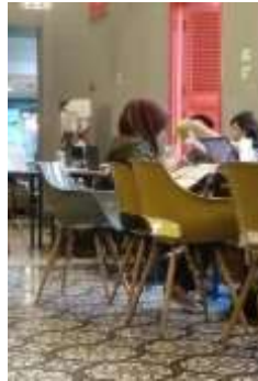
Gambar 2: Kursi cafe

Pengguna yang duduk di kursi cafe material kayu ini, memiliki batas rasa nyaman yang lebih lama dibanding pengguna stool kayu, karena kursi memiliki sandaran yang mampu menopang punggung pengguna. Penggunaan material kayu yang keras masih menimbulkan rasa kurang nyaman jika duduk terlalu lama. Ketidaknyamanan ini dirasakan di bagian tulang duduk dan paha.