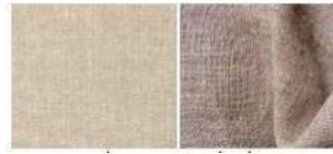
Gambar 9: Contoh Linen