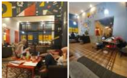
Gambar 7: Pengunjung Area Sofa Double Seater dan Easy Chair

Menurut pengamatan yang dilakukan, area sofa double seater dan easy chair didominasi oleh kalangan remaja. Mereka lebih memilih area yang santai dan nyaman untuk mengerjakan tugas ataupun belajar. Bahkan alasan lainnya adalah kalangan remaja dapat singgah selama 24 jam dan tidur di cafe dengan nyaman di area ini. Sedangkan untuk kalangan dewasa jarang terlihat menduduki area ini, karena selalu penuh atau kalah cepat dengan pengunjung remaja. Beberapa pengunjung dewasa yang memilih duduk di area sofa double seater dan easy chair hanya ingin merasakan kenyamanan yang lebih dan bersistirahat sejenak, setelah itu mereka akan langsung pulang atau kembali ke kantor tanpa membuang waktunya. Berbeda dengan tujuan para pengunjung remaja yang ingin nongkrong, berbincang-bincang hingga tidur.