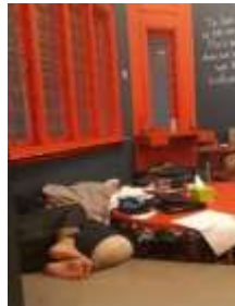
Gambar 8: Pengunjung Area Fainting Sofa Double Seater

Menurut pengamatan yang dilakukan, jelas sekali bahwa area ini didominasi oleh kalangan remaja. Bahkan hampir tidak ada pengunjung dewasa yang duduk di area ini. Sejak pertama kami datang, area fainting sofa double seater ini sudah dipenuhi oleh pengunjung yang tidur, berselonjor, hingga berbincang-bincang sambil membuka laptop di depannya. Pengunjung tersebut bertahan sangat lama hingga mencapai 4 atau 5 jam lamanya, apalagi pengunjung yang tidur bisa menghabiskan lebih dari 12 jam di cafe tersebut. Beberapa kalangan dewasa yang singgah di area tempat duduk ini tidak membicarakan pekerjaan mereka atau pun mengerjakan tugas mereka. Mereka hanya singgah untuk makan, bersantai dan berbincang – bincang setelah itu mereka akan pulang atau kembali ke kantor. Karena, area fainting sofa double seater ini memiliki suasana yang santai hingga membuat pengunjung mengantuk, sehingga tidak cocok bagi orang dewasa yang berkunjung dengan tujuan meeting atau diskusi pekerjaan.