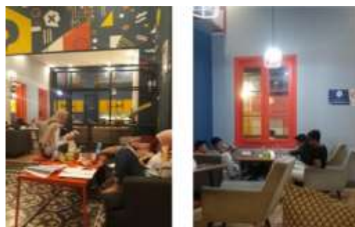
Gambar 3: Sofa double seater dan easy chair

Pengamatan pertama dilakukan terhadap pengunjung yang duduk di sofa double seater dan easy chair dengan sandaran lengan bermaterial busa dan upholstery kain poliester. Untuk sofa double seater dan easy chair memiliki ketebalan busa dudukan sekitar 15cm dengan tingkat kepadatan busa yang sedang. Pengunjung yang duduk di sofa ini mulai datang pada pukul 16.00. Pengunjung cenderung berlama-lama dan bersantai sambil makan, mengerjakan tugas atau berbincang-bincang. Material yang empuk dan sejuk cenderung membuat penggunaannya merasa nyaman dan betah. Sofa memiliki kedalaman tempat duduk sekitar 50- 60cm membuat penggunaannya semakin nyaman sehingga pengguna dapat merebahkan badannya dan menyangarkan kepala di sandaran sofa. Dengan kondisi seperti ini pengunjung dapat bertahan di tempat duduknya sampai pukul 19.00. Namun ketika pengunjung datang di malam hari untuk tujuan mengerjakan tugas bersama, pengguna yang duduk di sofa double seater dengan sandaran dapat bertahan selama lebih dari empat jam hingga tertidur. Seperti pengamatan yang dilakukan pada pukul 22.00 hingga pukul 02.00.