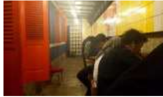
Gambar 5: Pengunjung Area Stool

meeting atau diskusi, maka mereka akan memilih untuk menyewa meja di lantai 2 atau berpindah ke tempat lain.