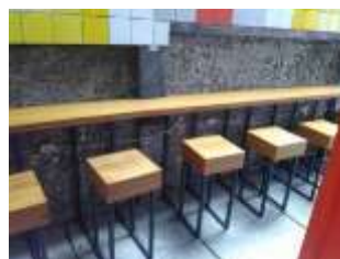
Gambar 1: Stool Built-in Kayu

Pengamatan pertama dilakukan terhadap pengunjung yang duduk di stool built-in dengan material dudukan kayu. Pengunjung datang pada pukul 15.00, pada jeda waktu satu jam, pengunjung berdiri dan mencari tempat duduk lain yang kosong. Kemudian pengunjung berpindah setelah menemukan tempat duduk yang dirasa lebih nyaman. Sehingga perputaran pengunjung di fasilitas duduk jenis stool kayu sangat cepat. Pengguna yang duduk di stool dengan material kayu, memiliki kecenderungan untuk bertahan dalam waktu yang sebentar. Dugaan sementara hal ini terjadi karena penggunaan material kayu yang keras, membuat posisi duduk kurang nyaman karena menimbulkan tekanan pada bagian tulang duduk, paha dan tulang belakang sehingga membuat pengguna lebih cepat berpindah dari tempat duduknya.