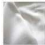
Gambar 10: Contoh Rayon