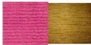
Gambar 11: Contoh Chenille