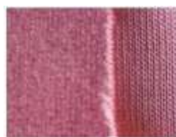
Gambar 9: Contoh Polyester

Secara umum bahan pelapis kursi atau sofa terdiri dari tiga macam, yaitu kain ( fabric ), kulit asli ( leather ), dan kulit imitasi ( synthetic leather ). Menurut (Artdina (2014) dalam Fatimah, 2013), kain banyak dipakai sebagai bahan pelapis sofa karena memiliki kelebihan dalam beragamnya warna, tekstur, motif dan jenis.. Beberapa jenis bahan kain yang beredar dipasaran yaitu Cotton/Katun , kain ini relatif nyaman, dingin, harga terjangkau, mudah robek, warna tidak tahan lama, rentan terhadap noda dan air. Selain itu bahan kain Polyester yang memiliki sifat mudah terlipat, mudah menyerap minyak, cukup awet, dan rentan terhadap air. Bahan jenis Linen memiliki tekstur yang lembut, terbuat dari serat alami, lebih kuat dibandingkan katun, mudah berkerut, dan panas di kulit. Bahan jenis Chenille memiliki tekstur lembut, mirip rajutan, serat rapat, awet, susah dibersihkan, rentan terhadap air. Sedangkan untuk bahan Rayon/ viscose memiliki sifat kuat, tekstur halus, mudah terbakar, rentan terhadap air (Fatimah, 2013).