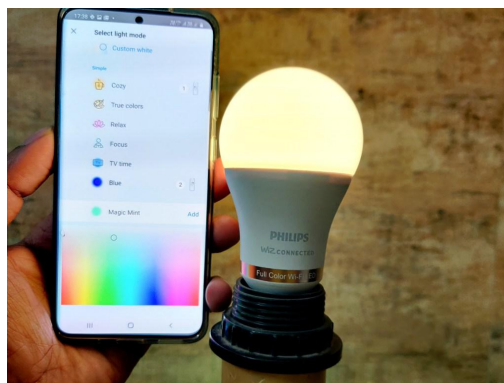
Gambar 1. Teknologi IoT pada Lampu

Pencahayaan pada desain interior merupakan hal yang penting karena sebagian besar peran desain akan terlihat dengan adanya pencahayaan khususnya pada malam hari. Cahaya dan efek yang dihasilkan sebuah ruangan merupakan kunci keberhasilan dari fungsi ruang (Hendrassukma, 2014).