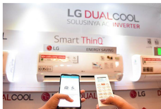
Gambar 2. Teknologi IoT pada AC

Fasilitas penghawaan merupakan suatu sistem pada desain interior usaha pembaruan udara dalam ruang baik secara alami maupun secara buatan dengan pengaturan yang baik dengan harapan untuk mencapai tujuan kesehatan dan kenyamanan penghuni dalam suatu ruangan. Sistem penghawaan pada rumah tinggal dapat terjadi secara alami dengan bantuan bukaan-bukaan pada ruangan sedangkan penghawaan yang terjadi secara buatan dibantu oleh suatu alat atau benda elektronik. Benda elektronik tersebut dapat berupa exhaust fan , ventilating fan , dan AC. Saat ini sistem yang diketahui dapat dikombinasikan dengan Smart Home berbasis IoT adalah AC dengan teknik kontrol otomatis jarak jauh. Penghawaan yang mengatur Monitoring suhu dan controlling AC dapat dilakukan melalui aplikasi dengan menggunakan fasilitas IoT (Vinola & Rakhman, 2020).