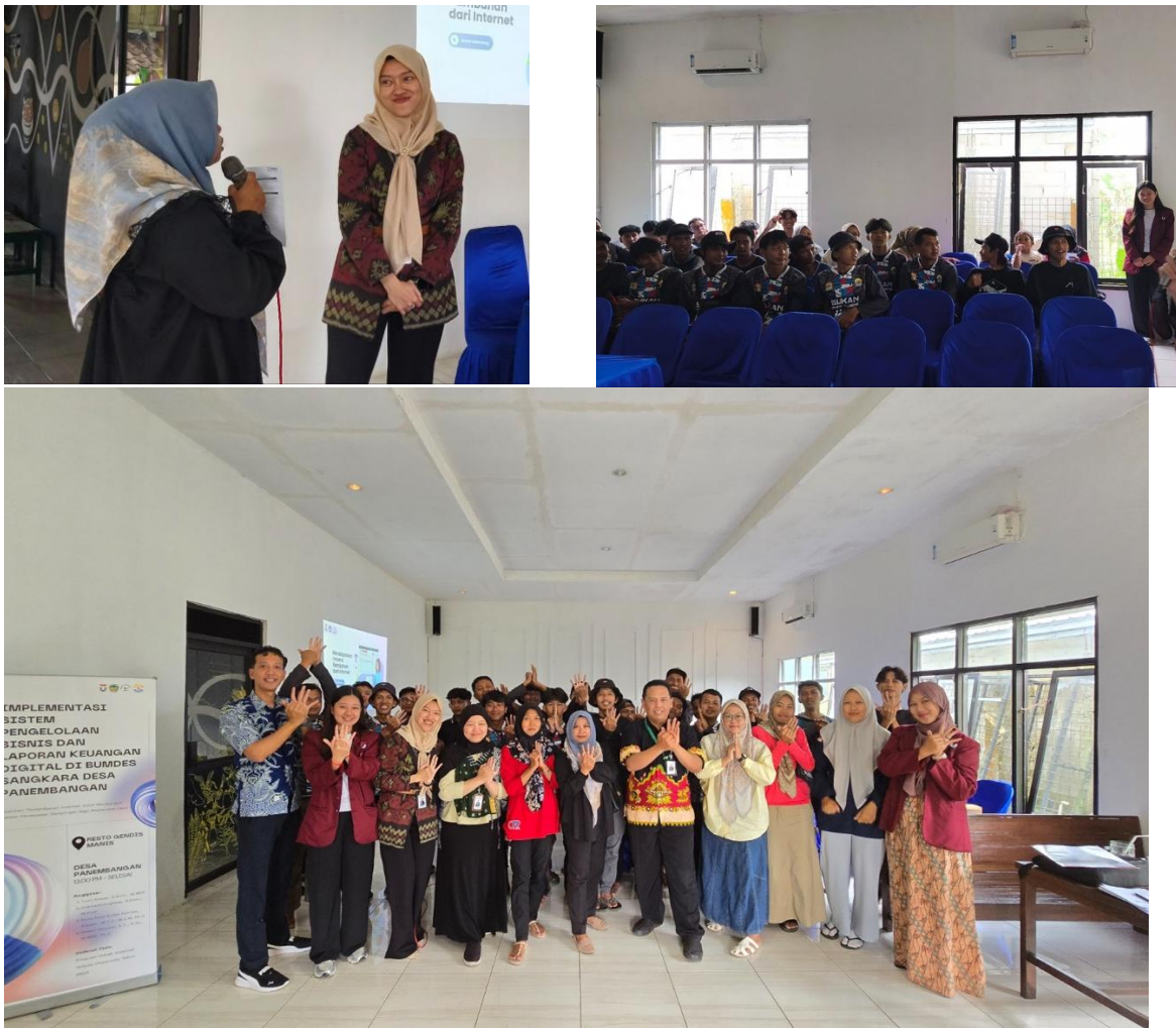
Gambar 3. Pelaksanaan kegiatan gambar 3A Peserta menanyakan pertanyaan untuk pembicara gambar, 3B Peserta pendampingan teknis, 3C Dokumentasi

keuangan bulanan dan tahunan menggunakan aplikasi VestNet. Hasil pendampingan menunjukkan bahwa pengurus BUMDes mampu mengoperasikan sistem secara mandiri, serta memiliki kepercayaan diri dalam mengelola dan menyajikan laporan keuangan berbasis digital.