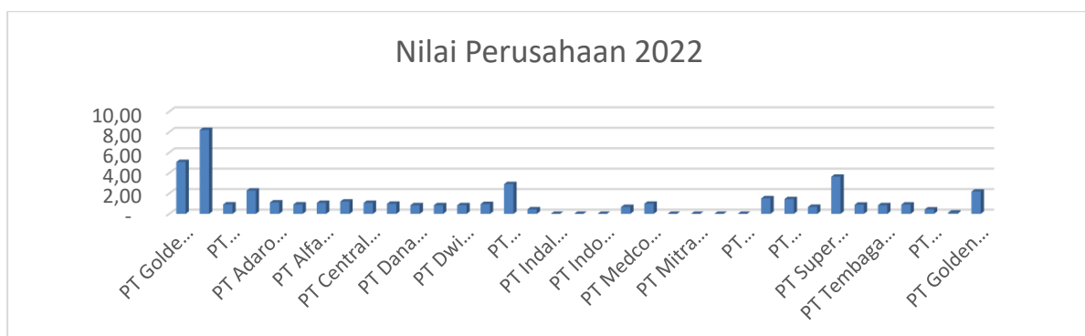
Gambar 1. Nilai Perusahaan Industri Pertambangan Periode Tahun 2022

Berikut merupakan grafik nilai perusahaan pada Industri pertambangan tahun 2022: