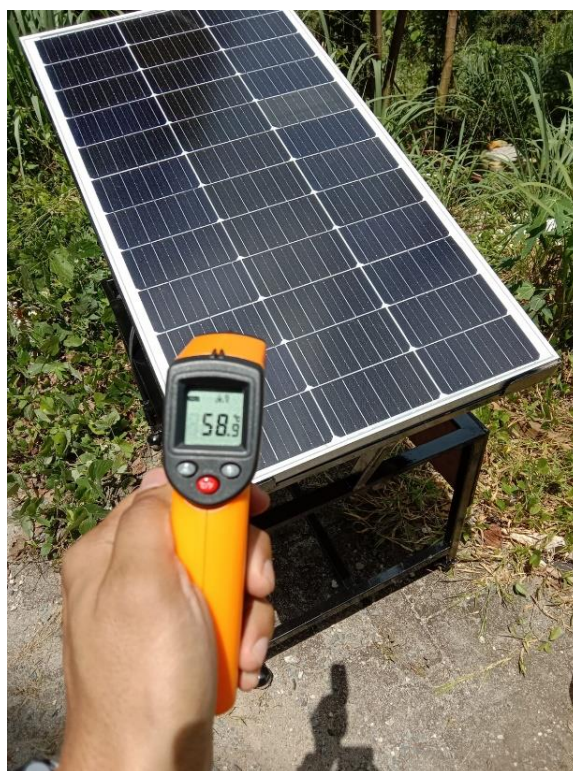
Gambar 1. Pengujian Potensi Energi Listrik di Gedung UMPAR

Pengujian untuk analisis potensi energi listrik yang dihasilkan oleh panel surya di Gedung F, Universitas Muhammadiyah Parepare dilaksanakan selama 20 hari. Pengujian ini dilakukan dengan menggunakan satu buah Panel Surya 100WP yang dipasang pada salah satu bagian Gedung dengan kemiringan 20°. Pengukuran suhu permukaan panel dan tegangan dilakukan setiap 1 jam, mulai Jam 10.00 WITA sampai dengan 16.00 WITA. Hasil pengujian nilai tegangan dan suhu ditunjukkan pada Gambar 1.