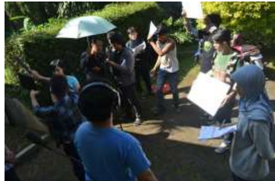
Gambar 1 Proses shooting film pendek "love Tester"

Indonesia. Komunitas ini telah memproduksi sejumlah 20 film pendek dan menyelenggarakan kursus film untuk masyarakat secara terbuka. Secara garis besar komunitas-komunitas ini mempunyai kegiatan berupa: Pemutaran/Exhibisi, Diskusi, Workshop perfilman dan produksi film.