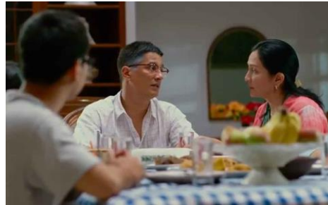
Gambar 3. Adegan ketika si ibu memberikan pengumuman akan menjual rumah, terlihat dominasi sang ayah sebagai pemimpin keluarga.

Babak pertama ini juga menceritakan dilema Dika yang sedang sedih dan gundah tentang kisah cintanya dan kesibukan sebagai penulis novel yang dikejar dateline . Hal tersebut membuat Dika tidak memiliki banyak waktu untuk keluarganya terutama dengan sang ayah. Papa Dika yang responsif merasakan perubahan itu dan langsung menanyakannya kepada Dika untuk berbincang bersama. Berulang kali Dika menolak ajakan sang ayah, karena menurut Dika ayahnya tampak tidak berkelakuan seperti biasanya yang cenderung tegas dan cuek terhadap dirinya. Upaya pendekatan papa Dika terhadap dirinya dianggap sebagai cameo belaka dan tidak perlu direspon segera.