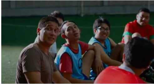
Gambar 5. Adegan ketika sang ayah secara tiba-tiba datang ke lapangan futsal dan berinteraksi dengan teman-teman Dika.

tindakan ini berlebihan dan tidak sesuai dengan ciri kompetisi dalam olahraga, ini adalah salah satu bentuk tindakan melindungi.