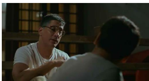
Gambar 4. Adegan ketika sang ayah curhat kepada Dika mengenai keinginan untuk semakin sering bersama dengannya.

memiliki banyak memori berkualitas dari kebersamaan mereka, terlebih di usia sang ayah yang rawan terhadap penyakit. Dika yang merasa papanya adalah figur mandiri sangat peduli terhadap kesehatan dengan rutin berolahraga merasa papanya kebal terhadap segala ancaman penyakit. Logika Dika ini semakin memperkuat asumsi gender maskulin yang muncul dalam karakter sang ayah.