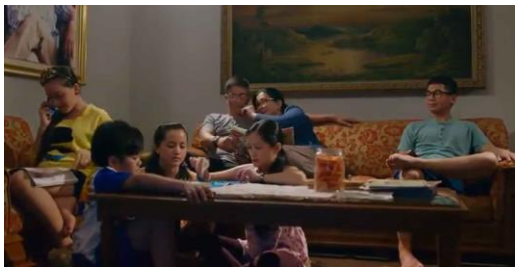
Gambar 2. Prolog film Manusia Setengah Salmon yang menggambarkan keluarga Dika sebagai tokoh utama dalam film.

keseharian sesuai dengan narasi yang disampaikan. Keluarga Dika adalah keluarga kalangan menengah atas terdiri dari kedua orang tua, papa dan mama Dika, beserta Dika sebagai anak tertua dengan keempat orang adiknya yang penggambaran kelasnya bisa terlihat dari interior ruang yang menjadi set dalam adegan.