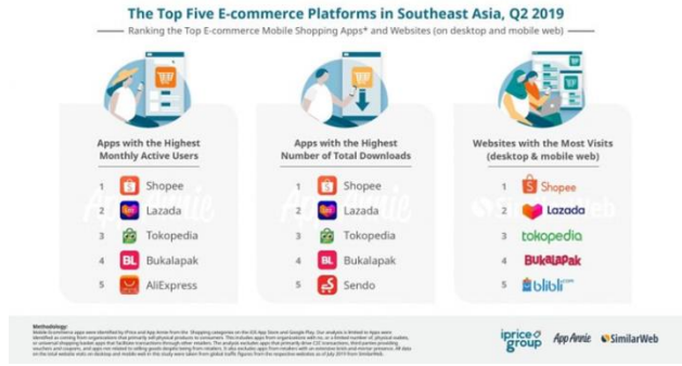
Gambar 5. Kedudukan Shopee Sebagai Platform E-Commerce Terbesar di Asia Tenggara

Lalu, dilansir dari Kr-Asia.com, berdasarkan data yang dipublikasikan oleh Iprice Group melalui bantuan AppAnnie dan SimilarWeb, Shopee menduduki peringkat pertama dalam tiga kategori sebagai 'The Top Five E-Commerce Platforms in Southeast Asia' pada Q2 di tahun 2019, antara lain aplikasi dengan jumlah pengguna aktif tertinggi; aplikasi dengan jumlah pengunduh terbanyak; serta website dengan jumlah pengunjung terbanyak (baik melalui desktop maupun mobile website).