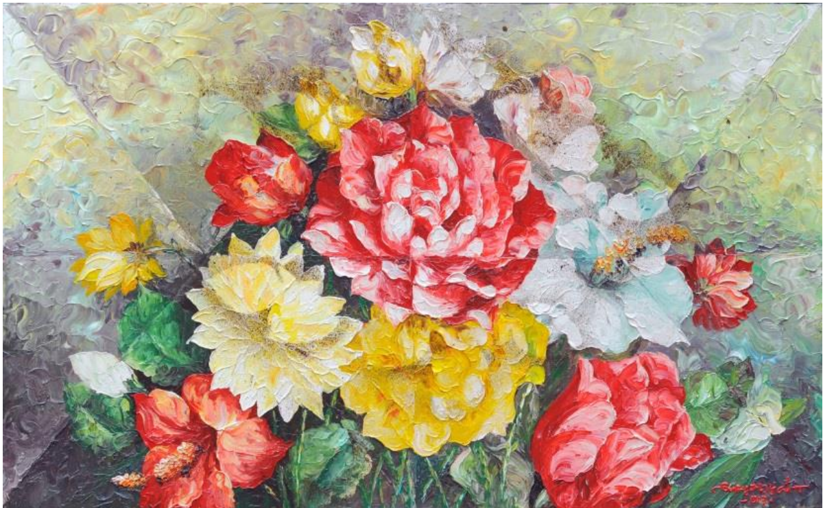
Gambar 3 Didi Suryadi, Bunga dan Komposisi , 2017, cat minyak di kanvas, 90x150 cm. Foto: Selasar Sunaryo Art Space

Di dalam tulisan Dua Seni Rupa , Sanento Yuliman menjelaskan apa yang dia maksud sebagai 'seni rupa bawah' adalah seni rupa yang proses produksi, distribusi dan konsumsinya terjadi di lapisan menengah-bawah, baik di kota besar maupun terutama di kota kecil dan desa. Beredar terutama di lapisan semacam itu, seni rupa ini bertalian dengan ekonomi lemah dan taraf hidup yang rendah serta dipraktekan oleh masyarakat kurang terpelajar (dalam artian tanpa mendapatkan pendidikan formal). Produksi hasil seni rupa bawah, juga bertalian dengan penggunaan cara dan alat sederhana, bahkan sebagian peralatan dibikin secara swadaya (dibikin sendiri).