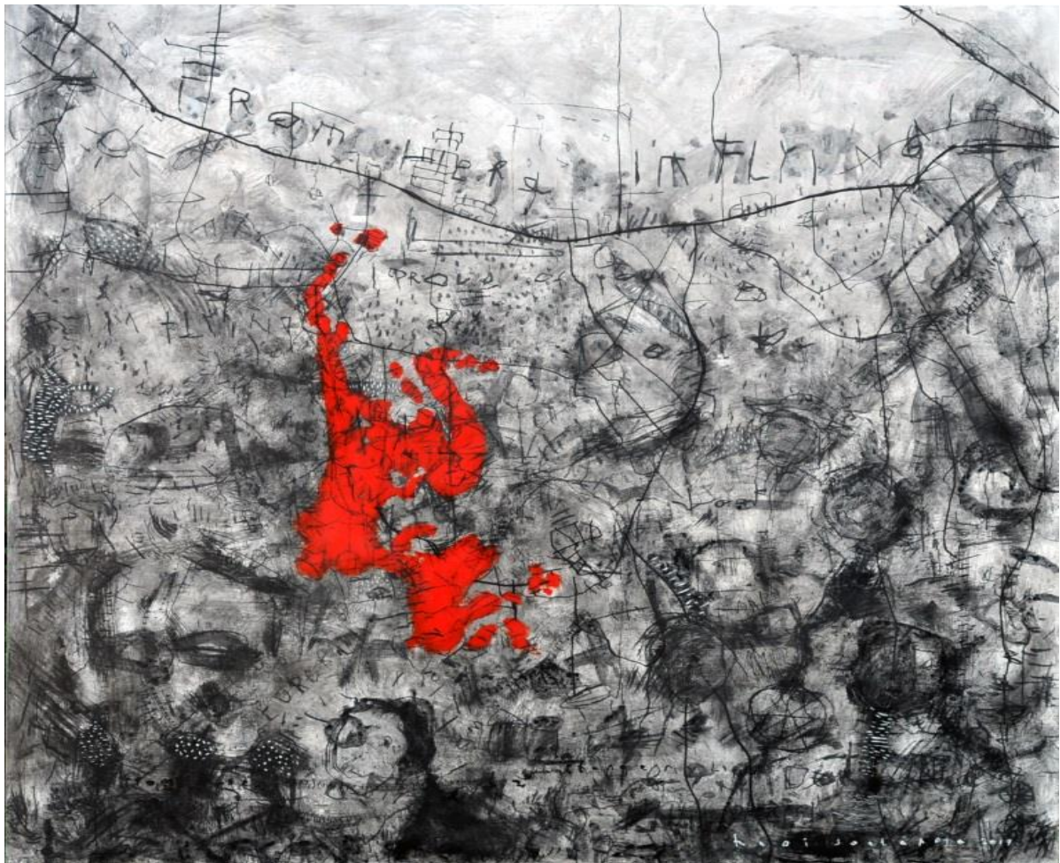
Gambar 2 Hedi Soetardja, Jelekong #1 , 2017, media campur di kanvas, 200x200 cm.

Lukisan jenis lain itu memiliki beberapa perbedaan dengan lukisan Jelekong pada umumnya yang sudah dilakukan turun temurun. Dalam hal tematik/ objek lukisan, lukisan-lukisan itu tidak lagi berkuat pada pemandangan alam, kumpulan binatang atau bunga. Sebagai gantinya, objek dalam lukisan sangat beragam dengan komposisi rupa yang lebih kompleks dan beragam pula. Keberagaman objek lukisan itu juga memperlihatkan perbedaan yang lain, yaitu dalam hal gagasan melukis. Bagi para pelukis “nakal” itu, lukisan adalah perwujudan dari gagasan dan pandangan mereka terhadap suatu persoalan, lukisan adalah bentuk representasi sebuah persoalan. Karenanya objek-objek dalam lukisan mereka, bisa berkaitan dengan berbagai macam persoalan, dari personal, spiritual, lingkungan, sosial hingga politik.